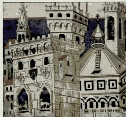
Veduta di Firenze dal codice del Biadaiuolo (Biblioteca Laurenziana, 1321-1335)

mittenza ai vertici della società comunale, che Arnolfo ha saputo mediare e orientare nei cantieri maggiori, concepiti a scala urbana. Lo spazio cittadino non rimane però isolato, e l'esportazione dei modelli urbani si diffonde nelle terre nuove del contado, veri «laboratori insediativi» pianificati nelle campagne dalle strategie di espansione della classe dirigente. In definitiva, ricerche come queste valgono soprattutto per il metodo adottato: aiutano a uscire dagli orizzonti limitati di una sto-