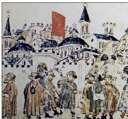
Pellegrini a Roma per il Giubileo del 1300. Miniatura dalla «Cronica» di Giovanni Sercambi (Lucca, Archivio di Stato, ms. 107)

Il sistema delle cultural routes richiama quello della World Heritage List dell'Unesco: ogni anno vengono proposte al Consiglio d'Europa le nuove candidature, vagliate da un'apposita commissione e accettate se giudicate in possesso dei requisiti necessari. L'ammissione implica un sostegno economico e una maggiore visibilità dell'itinerario, con ricadute sul turismo di qualità. Attualmente fanno parte della lista 29 itinerari, ma il