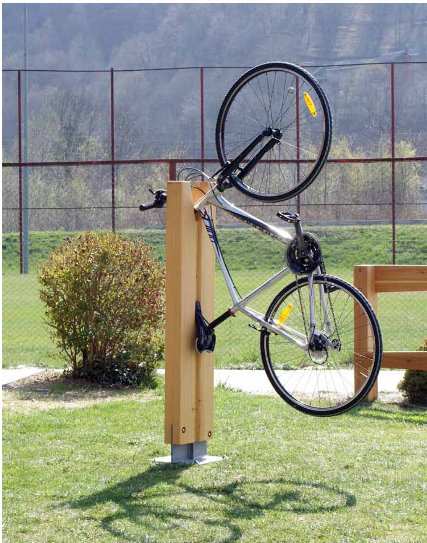
Opplà : stazioni per la manutenzione biciclette lungo i percorsi del progetto CycloTerritoire.