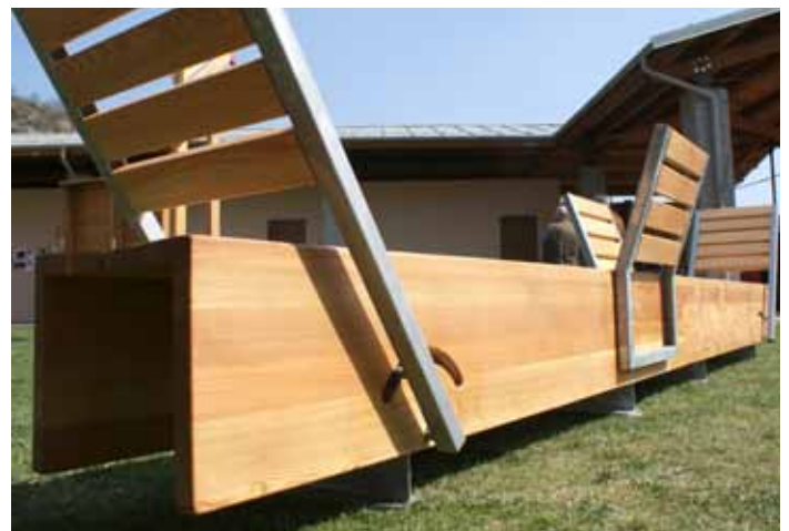
TaVola: attrezzatura pic-nic accessibile e con posto disabili su sedia a ruota sulle testate. Il bordo del tavolo funziona anche come schienale.

Va da sé che il legno massello ben si presta agli impieghi in esterno e in particolare in spazi non controllati, in virtù delle sue ottime prestazioni in termini di comfort ergonomico (pensiamo alle superfici di contatto nelle sedute), di resistenza strutturale in condizioni atmosferiche variabili (sole e gelo), di resistenza al vandalismo offerta da spessori generosi di assi e travetti, oltre alla piacevolezza espressiva della venatura a vista e di una naturale vocazione del legno all'integrazione con il paesaggio montano. Sulla durabilità, invece, si è dovuto lavorare in termini di sperimentazione tecnologica per cercare di rallentare i naturali processi di deterioramento superficiale, porosità e ingrigimento da radiazione UV ad esempio, al fine di diminuire gli oneri di manutenzione connessi a manufatti collocati sovente in aree isolate e in quota. Significativo, al riguardo, lo studio condotto sulle