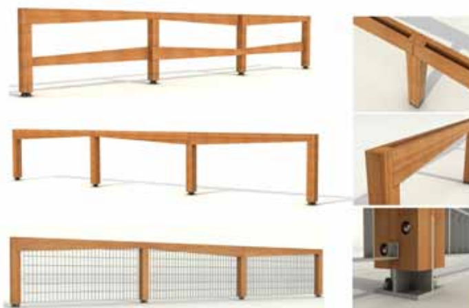
Alt: sistema di recinzioni e ringhiere in versione aperta o chiusa. In larice o frassino con grigliato elettrozincato.