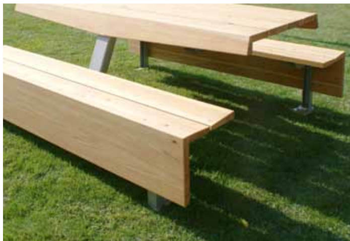
Tronca: seduta modulare organizzabile con schienali prendisole ribaltabili e schienali fissi o strumenti ginnici.

Il legno, risorsa diffusa nei territori montani piemontesi, in Valle Varaita già da alcuni anni è stato oggetto di progetti di valorizzazione nell'ottica di rilancio del savoir-faire artigianale e del sistema produttivo locale in un'ottica di filiera e di progetto condiviso. Dopo le esperienze sul "re-design del mobile alpino", condotte dall'unità di Ricerca di Design del Politecnico di Torino (2000/2001), e quelle del Centro per la Lavorazione Artigianale del Legno di Isasca (2006), creato a supporto delle attività produttive del distretto regionale di Verzuolo (carta e artigianato ligneo), oggi la ricerca/azione esplora, come nuovo ambito, la produzione di "arredi per esterni".