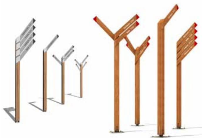
Ramo: sistema modulare per la segnaletica direzionale nelle versioni palo in legno e rami in alluminio serigrafato o alucobond fresato, oppure tutto-legno, con messaggi fresati e verniciati o pirografati.