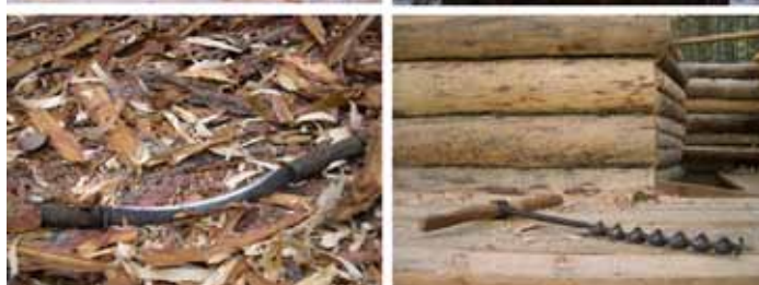
Alcuni attrezzi finlandesi per la lavorazione del legno.

prototipo di costruzione lignea con la collaborazione di molti partners europei e di quelli finlandesi in particolare (Università di Oulu, Helsinki e Turku, docenti, carpentieri e studenti) al fine di confrontare le prassi costruttive e le "regole dell'arte" di saperi diversi: un confronto tra tecniche di lavorazione delle carpenterie in legno dei paesi scandinavi e le nostre, ancora vive e presenti proprio sul territorio della Val di Susa.