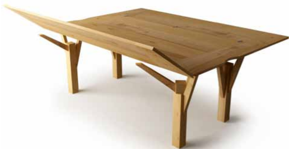
Selvatico. Collezione di arredi per interni in castagno, con tavole di forma irregolare (per economia di risorse) derivanti dalla naturale geometria del tronco. Tavoli fissi o ampliabili, in cui uno dei rami è orientabile per costituire il supporto della plancia.