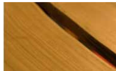
Sono in vena. Collezione di arredi per interni realizzati con tavole di acero o castagno lavorate su tre soli lati; il quarto conserva il profilo naturale del tronco. Tavolo con struttura in acciaio trafilato verniciato.