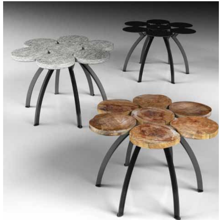
Sei a tavola. Collezione manifesto del rustico naturalistico per interni ed esterni con dischi di castagno o di pietra (removibili). Struttura in acciaio zincato taglio laser e verniciato. Dischi trattati con vernici a nano tubi.

Per ogni materiale venne adottato lo stesso metodo deduttivo: fissare con un fotogramma quel momento della lavorazione in cui la natura (universale) si trasforma in manufatto (particolare). Trovato il concetto, che si può riassumere nel fermare le mani, gli strumenti e le macchine in quel preciso momento, il resto è venuto sperimentando tagli e assemblaggi, realizzando modellini in scala attraverso i quali intuire