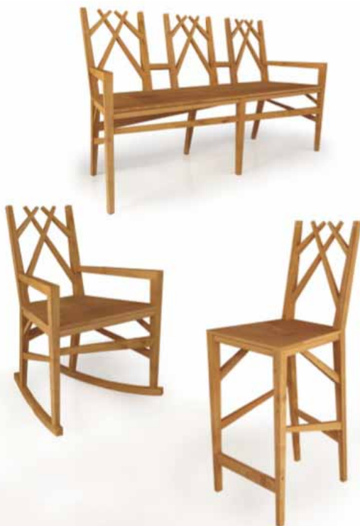
Selvatico. Collezione di sedute in massello di castagno. Il telaio realizzato con assi rastremate conferisce leggerezza e apparente asimmetria all'insieme.

Ricette non così facili per un artigiano di montagna abituato a schemi e stilemi consolidati, ma accettati perché questo approccio, per così dire "straordinario", rappresenta una alternativa che non sostituisce, ma si aggiunge, alla propria "ordinaria" attività.