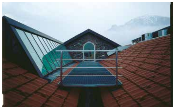
Torre Pellice, Galleria Tucci Russo.

Il work in progress dello studio per l'arte contemporanea di Tucci cresce fino all'ampliamento della galleria (2001-2002) con il recupero di nuove parti del complesso industriale in stato di completo abbandono. Il progetto di Dario Castellino recupera alla contemporaneità dell'arte la memoria di un contenitore che si vuole neutro, in un progetto come un racconto, che è anche continuità visiva e di percorsi (fino all'aerea passerella tra le falde dei tetti che si apre sulle montagne), che ripercorre la vita dell'edificio, attraverso una filologia raffinata e minimale attenta all'essenza,