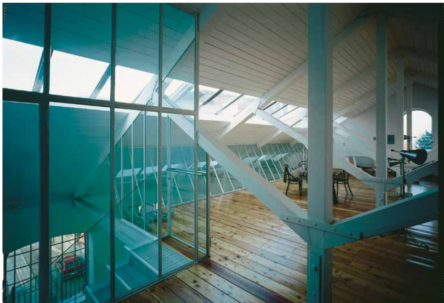
Torre Pellice, Galleria Tucci Russo.