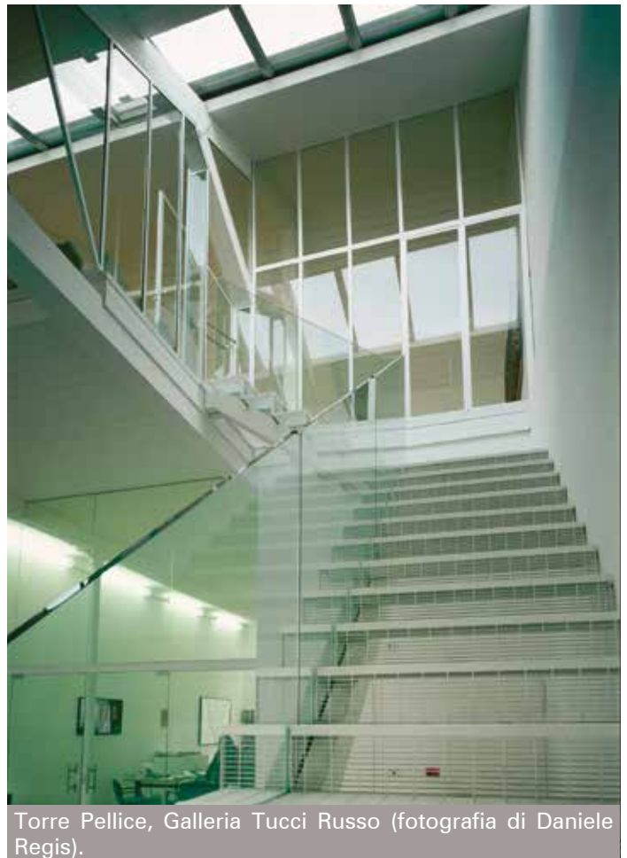
Torre Pellice, Galleria Tucci Russo.