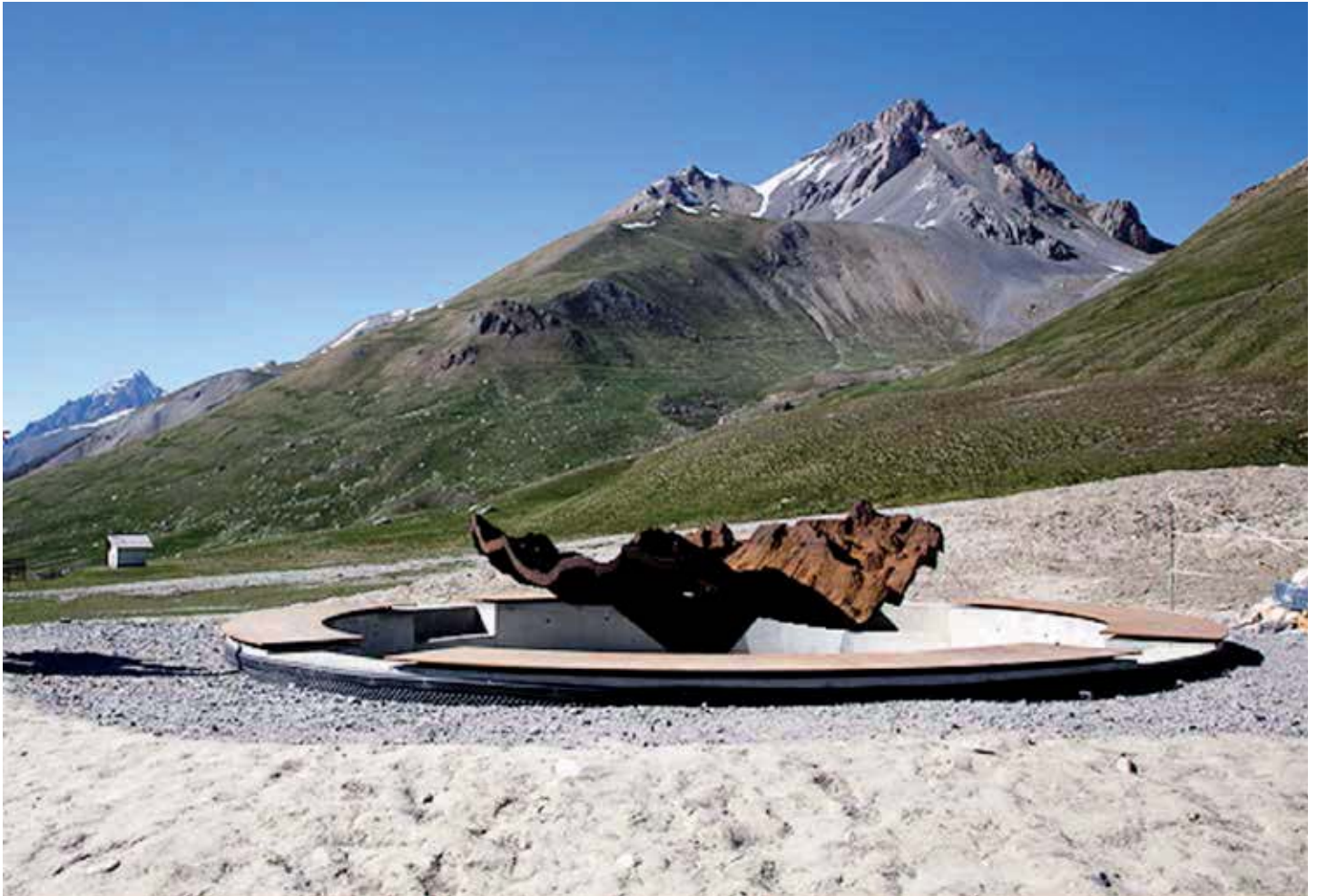
David Renaud, "Table Relief", VIAPAC Via per l'Arte Contemporanea, Col de Larche, Alpes de Hautes Provence, 2012.

e porta la riflessione sul complesso rapporto uomo-ambiente, prospettando un approccio non limitato alla dimensione del parco.