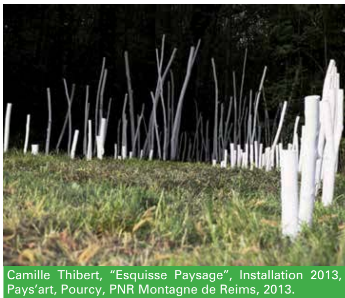
Camille Thibert, "Esquisse Paysage", Installation 2013, Pays'art, Pourcy, PNR Montagne de Reims, 2013.

dei parchi, o di tipo stabile e continuativo, nell'ambito di piani di riqualificazione paesaggistica e di risviluppo di distretti naturalistico-culturali.