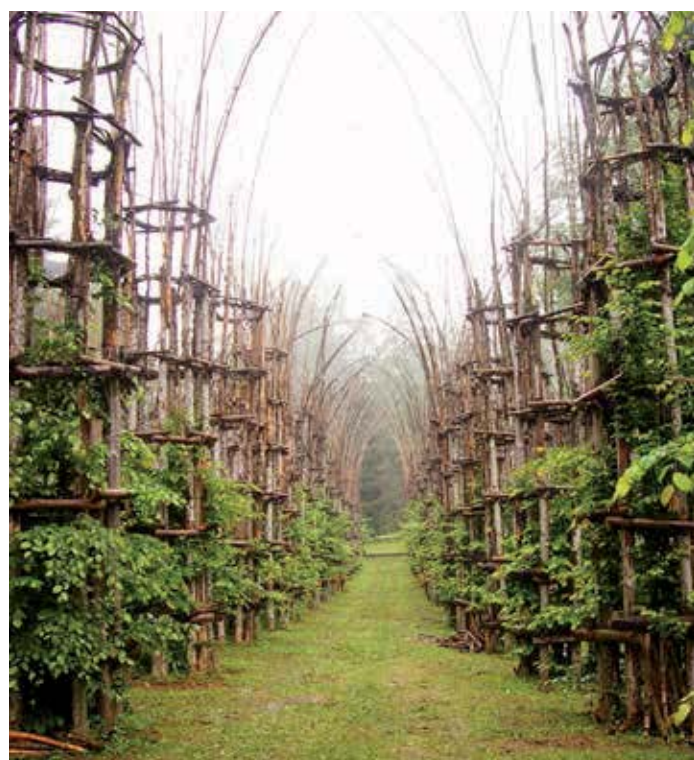
Giuliano Mauri, "Cattedrale Vegetale", Arte Sella 2002, disegno preparatorio, immagine.