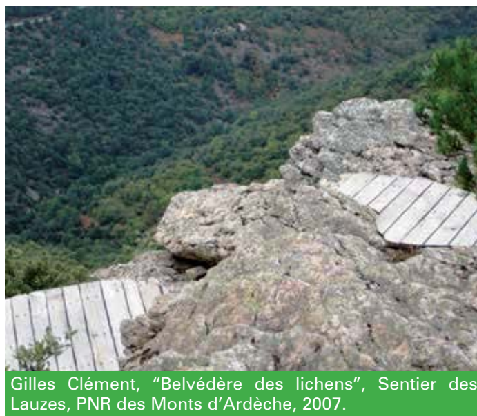
Gilles Clément, "Belvédère des lichens", Sentier des Lauzes, PNR des Monts d'Ardèche, 2007.

La reinterpretazione delle forme semplici della natura del luogo, fino a un'essenzialità quasi astratta nella prospettiva della land art , è centrale nelle pratiche artistiche effimere attraverso manifestazione occasionali o annuali, in molti parchi francesi. Nel cammino ad alta quota "Quatre" (2012) – fra Briançon, Château-Queyras, Les Vigneaux, Mont-Dauphin – nelle aree protette delle storiche fortificazioni del Queyras, nelle Hautes-Alpes, i land-mark ambientali sono creati da quattro artisti con materiali in situ, stimolano una riscoperta della storia e dell'architettura del territorio, comune ad abitanti e turisti.