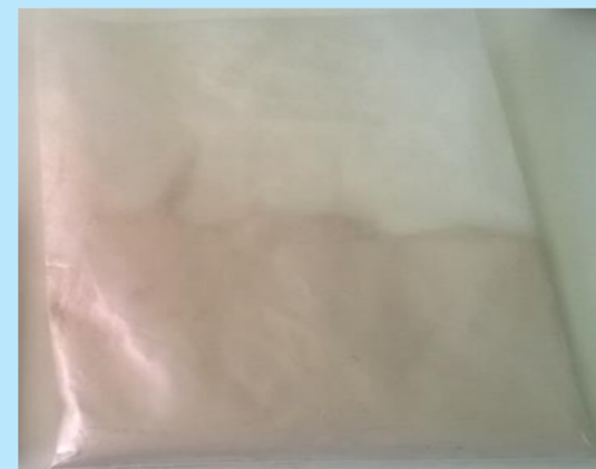
Tab. 1. Sinistra: proprietà geotecniche (Carrera, 2008). Fig. 1. Destra: campione (2) prima del trattamento gamma.