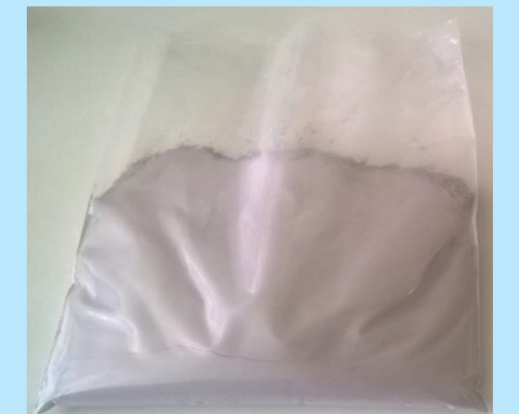
Tab. 2. Caratteristiche della radiazione gamma sui campioni (2) e (3). Fig. 2. Destra: campione (2) dopo il trattamento gamma.

L'energia fotonica imposta E_\gamma , l'attività A_\gamma della sorgente radioattiva utilizzata e il suo volume ( V_{S.R.} ) hanno permesso il calcolo dell'intensità I_\gamma della radiazione gamma che risulta 136 volte superiore all'intensità della radiazione ultravioletta: