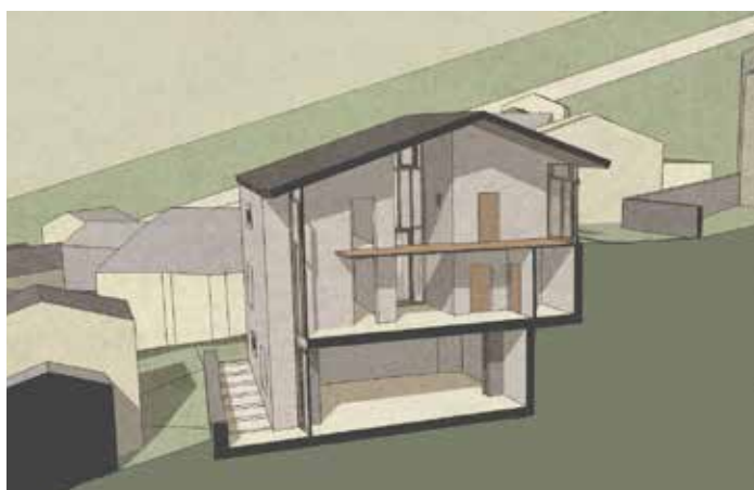
Sezione assonometrica di progetto (elaborazione 3D di Marie-Pierre Forsans).

Concludendo, dopo solo qualche settimana di vita può non sembrare un azzardo affermare che, fin dalle premesse, questo nuovo intervento per il comune di Ostana sembra proprio bene rappresentare – tanto nell'articolazione del suo programma funzionale, quanto nella sua figurazione architettonica – il cambio di paradigma di quei territori montani che, con lentezza e fatica, stanno sostituendo l'immagine del degrado e dell'abbandono, con quella di nuovi potenziali territori per l'abitare contemporaneo.