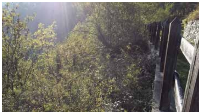
Tratti da ripulire dalla vegetazione invadente e aree di rifacimento muretti a secco.