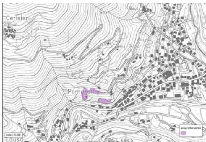
Comune di Pomaretto, interventi di recupero di aree a vigneto nella zona del Ramie attraverso il ripristino di muretti a secco. Aree d'intervento.