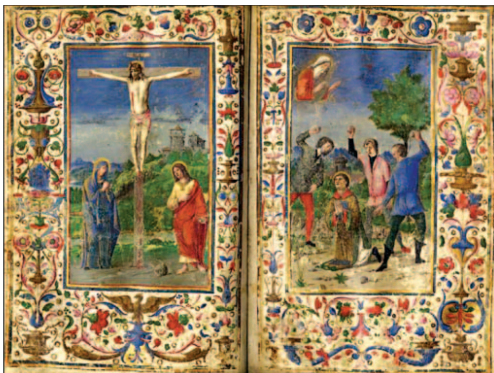
Mariegola della scuola di Santo Stefano, C1. IV 3, cc. 28v-29r; Crocifissione e Lapidazione del santo