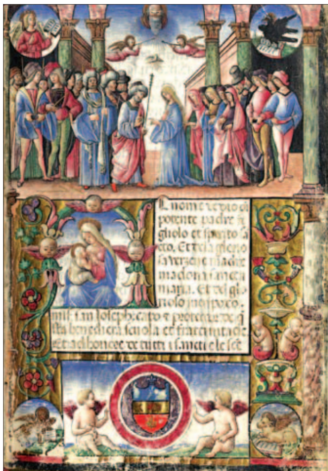
Mariegola della scuola di San Giuseppe, Cl. IV 10, c. 9r; Nozze di Maria e Giuseppe