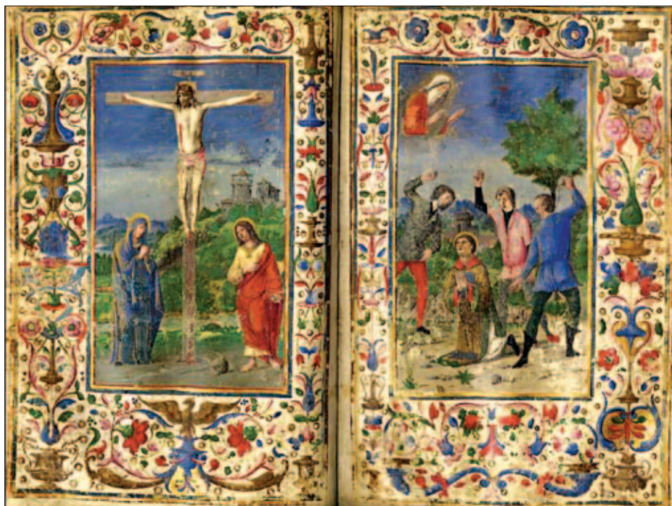
Mariegola della scuola di Santo Stefano, C1. IV 3, cc. 28v-29r; Crocifissione e Lapidazione del santo