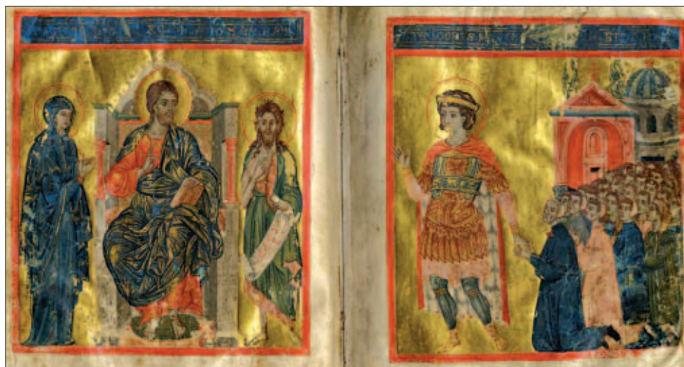
Mariegola della scuola grande di San Teodoro, C1. IV 21, cc. 52v-53r

Il lavoro di catalogazione, che continuerà con i numerosi progetti avviati e programmati e in attesa di finanziamento, è il risultato di una fruttuosa collaborazione tra la Biblioteca del Correr, la Regione Veneto e l'Università Ca' Foscari di Venezia, in particolare con la cattedra di Codicologia presso il Dipartimento di Scienze dell'antichità e del Vicino Oriente. Paolo Eleuteri, titolare della cattedra e coordinatore del progetto regionale "Catalogazione dei manoscritti delle biblioteche venete", ha sottolineato durante il convegno l'importanza di questa iniziativa di coordinamento in un settore piuttosto trascurato come quello della catalogazione dei manoscritti. In Italia (ma non solo qui) si cataloga poco e le biblioteche dotate di un catalogo del patrimonio manoscritto