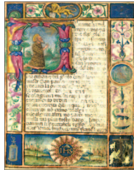
Mariegola dei peteneri e feraleri, C1. IV 96, c. XIIr

P.D. c 4, Cittadini veneziani, di Giuseppe Tassini: