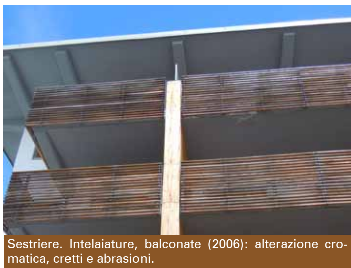
Sestriere. Intelaiature, balconate (2006): alterazione cromatica, cretti e abrasioni.