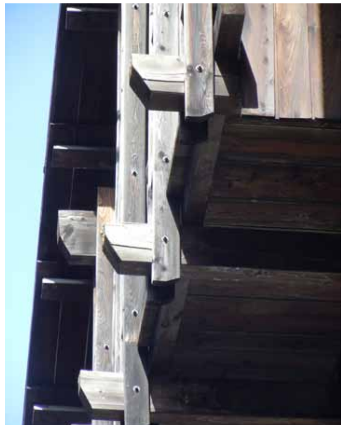
Sauze di Cesana. Intelaiature, balconate e rivestimenti parietali (anni ottanta): alterazioni cromatiche, abrasioni.