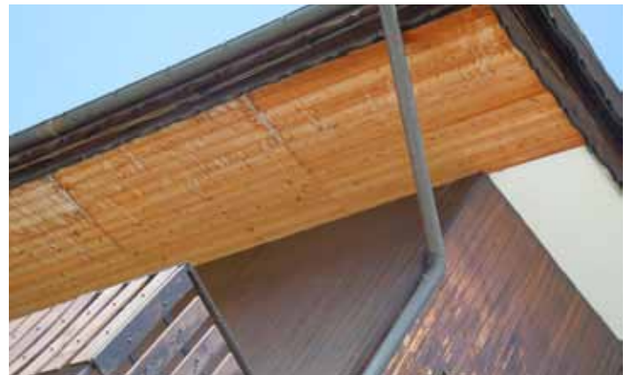
Sestriere. Rivestimenti parietali e cornicione (anni ottanta): alterazione cromatica, sfogliatura, degrado biotico, imbibizione.