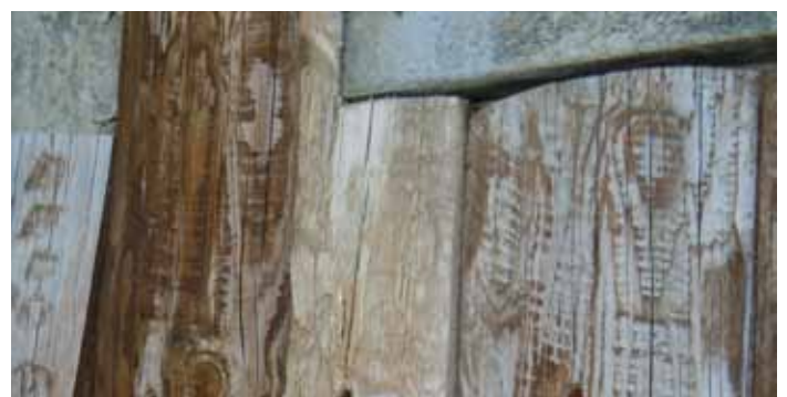
Sestriere. Rivestimenti parietali (inizio anni 2000): rottura terminale, alterazione cromatica, degrado biotico, marcescenza, distacchi.