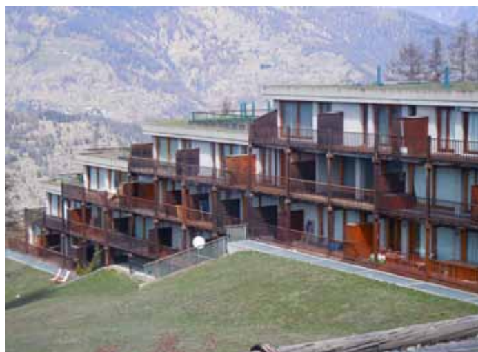
San Sicario Alto. Intelaiature, balconate (fine anni settanta): alterazioni cromatiche, abrasioni.