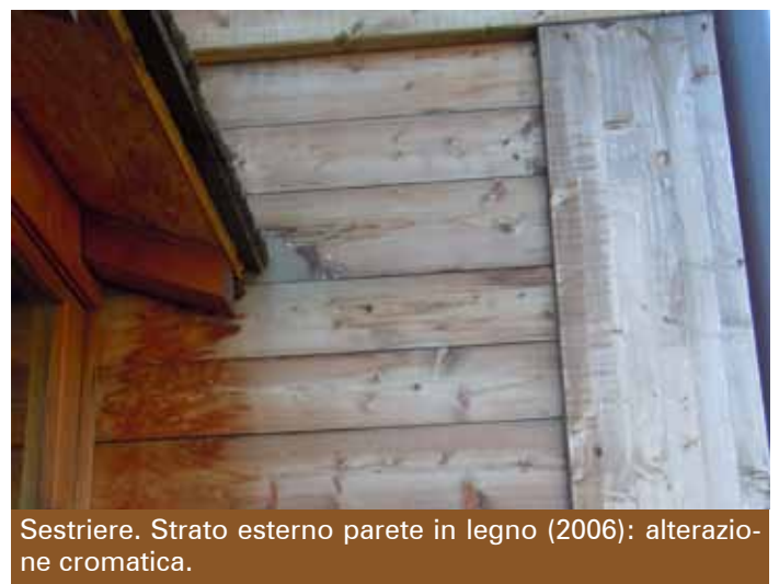
Sestriere. Strato esterno parete in legno (2006): alterazione cromatica.