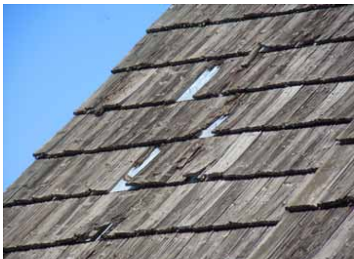
Sauze di Cesana. Scandole su lamina metallica (anni ottanta): ingrigimento, fessurazioni e distacchi.

l'innevamento, emerge, invece, il ruolo essenziale di programmi manutentivi predettivi e di ispezioni annuali, con intervento al manifestarsi dei primi segni di alterazione di aspetto e meccanica, al fine di mantenere limiti prestazionali, senza la compromissione degli elementi sottostanti e contigui.