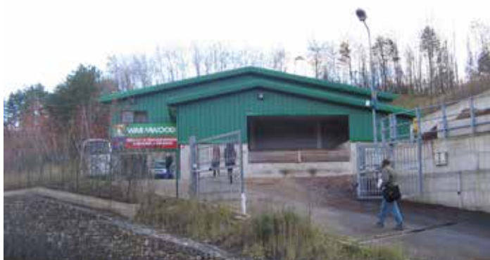
Lizzano in Belvedere (Bo). Centrale a biomasse forestali: ingresso (ITABIA-Italian Biomass Association).

Il comune denominatore dei lavori menzionati sta nel forte legame tra intervento e territorio, soprattutto nel coinvolgimento delle popolazioni, nella complementarietà tra l'attività energetica e le altre attività svolte – agricoltura, selvicoltura, turismo, educazione ambientale –, e inoltre nel considerare la produzione energetica solo l'inizio di un processo che dovrebbe coinvolgere una agricoltura sostenibile, un'edilizia a risparmio energetico ed ad alta efficienza, una mobilità clima-compatibile ecc., insomma una riformulazione della cura e dell'economia dello spazio montano. In questo antico ma "rinnovato" paradigma del modo di vedere la produzione di energia cosa si chiede agli addetti ai lavori, tra cui gli architetti? Non nuove regole ma di prefigurare interventi convincenti di buona integrazione con il contesto, e di accompagnare gli operatori (enti pubblici o soggetti privati) nel compimento delle opere. Nella realizzazione di nuovi impianti energetici ad esempio i casi virtuosi non mancano.