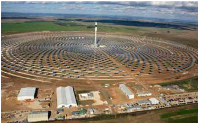
Impianto Gemasolar: centrale solare a concentrazione (Spagna).

Così tale questione, specialmente oggi, è un nodo ineludibile innanzitutto perché è un campo in forte espansione che potremmo definire multiscale: