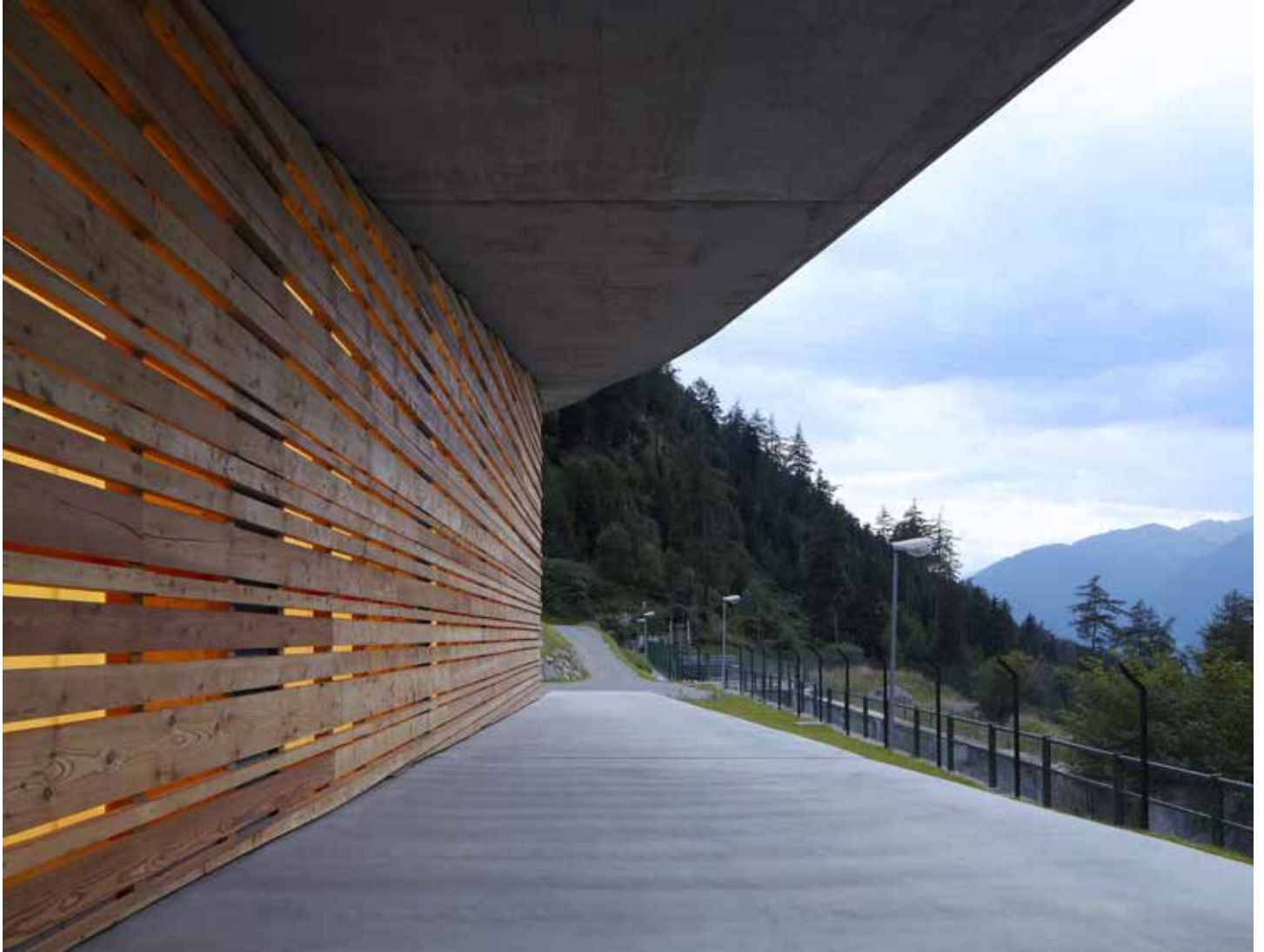
Centrale idroelettrica. Progetto studio Monovolume (Comune di Malles, BZ)