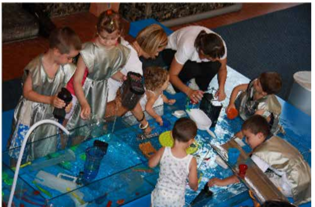
L'atelier "Di onda in onda" all'interno della centrale ENEL (Regione Emilia Romagna).